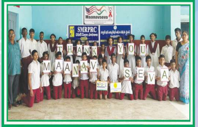
“మానవసేవ” వారికి కృతజ్ఞతలు తెలుపుతున్న విద్యార్థులు