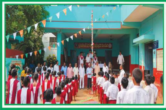
పాఠశాలలో జరిగిన గణతంత్ర దినోత్సవ వేడుకలు