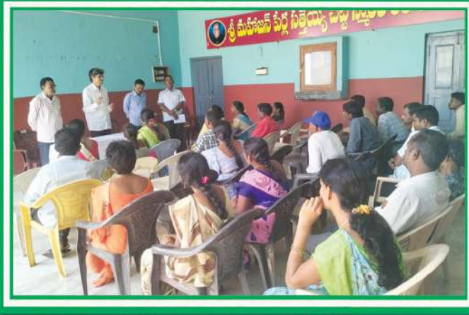
మన పాఠశాలలో జరిగిన ఉపాధ్యాయుల మరియు తల్లిదండ్రుల సమావేశం