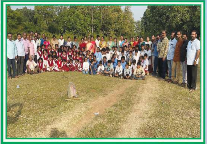
అంతర్జాతీయ విభిన్న ప్రతిభావంతుల దినోత్సవంలో మన పాఠశాల విద్యార్థులు నాట్య ప్రదర్శన