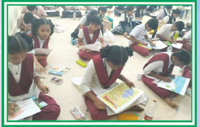
మన పాఠశాలలో జరిగిన చిత్రలేఖన పోటీలలో పాల్గొన్న మన విద్యార్థులు