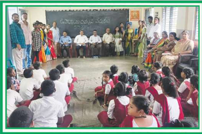
మన పాఠశాలలో జరుపుకున్న “ఉపాధ్యాయ దినోత్సవ వేడుకలు”