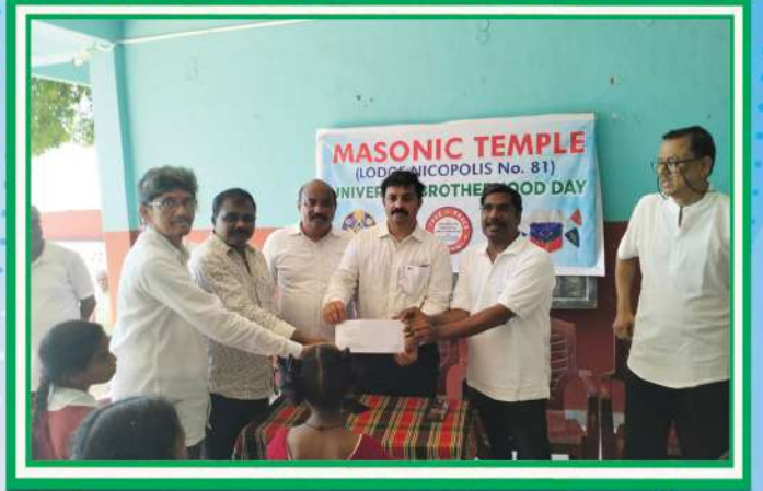
పాఠశాల అభివృద్ధికై మెసానిక్ టెంపుల్ వారిచే సంస్థ యాజమాన్యానికి చెక్కు అందచేత