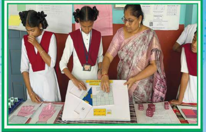
మన పాఠశాలలో జరిగిన జాతీయ గణిత దినోత్సవ వేడుకలు