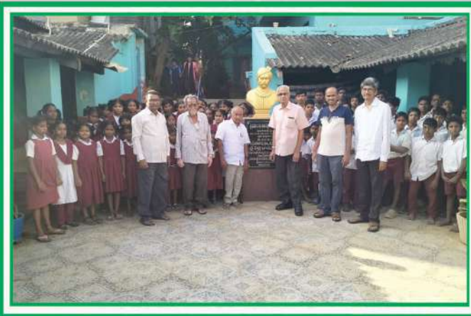
అల్లూరి మూర్తి రాజు గారిచే మన పాఠశాల సందర్శన