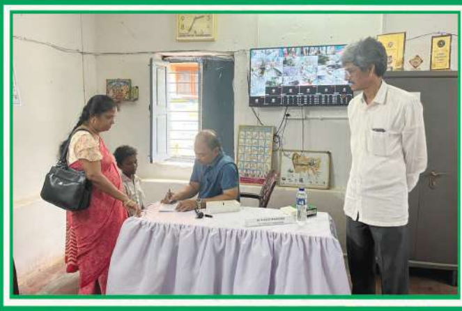
మన పాఠశాలలో నిర్వహించబడిన హెచ్.పి.వి. వ్యాక్సినేషన్ కార్యక్రమం